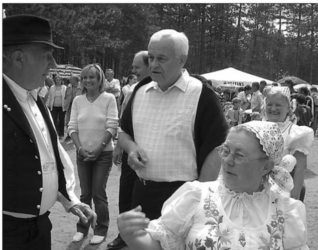
Verezen őrzik a hagyományokat