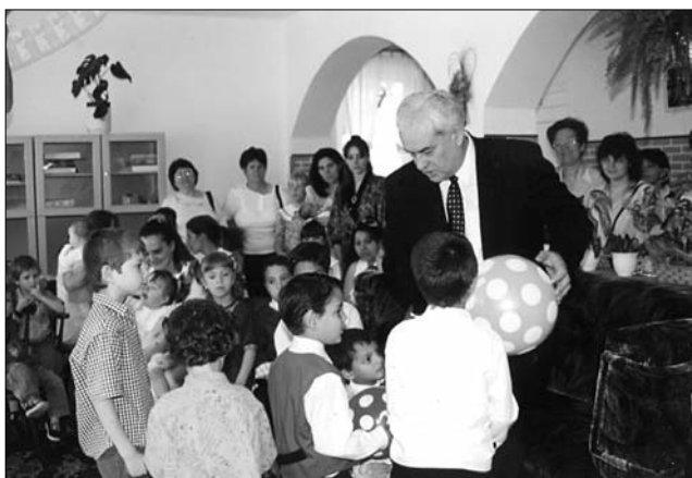
Jövők esélye a gyermek