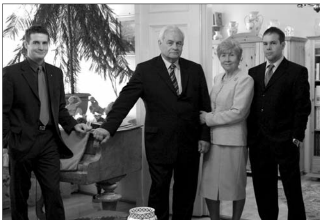
Csaknem teljes kör