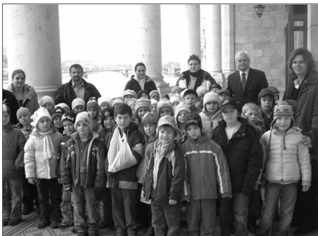
Ez több mint osztálykirándulás