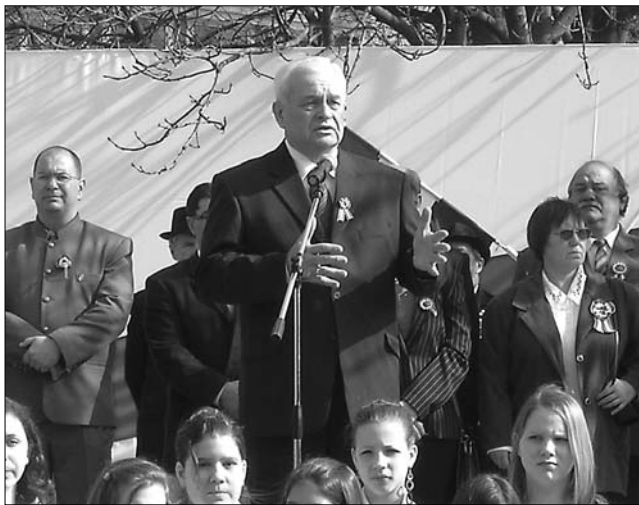
Az ünnep mindenkié